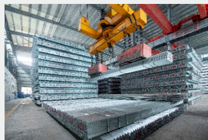
中拓物流张宁钰 吊装镀锌角钢 中拓物流临汾晋南库