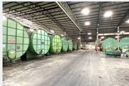
能化事业部来哲渊 橡胶部在泰国运营的