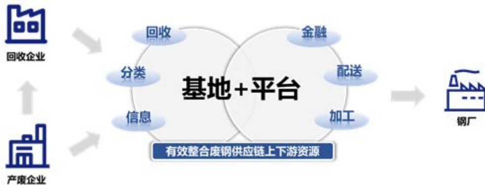
图 5：中拓再生钢铁原料“基地+平台”模式

该模式主要应用于再生资源产业链，在交易业务平稳推进的同时，充分整合上游资源，深度绑定终端客户，整合实体基地汇聚流量，构建集收购、金融、加工、配送、销售为一体的模式。公司已在再生钢铁原料、再生不锈钢、再生铝、再生 PET 等品种开展布局。