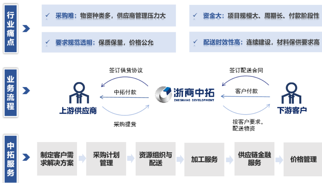
图 1：中拓工程配供配送模式

工业配供配送主要服务于制造业客户，针对客户生产过程中的原料需求，充分利用自身专业优势以及行业沉淀的上游资源网络提供供应链服务，降低供应链管理成本，满足制造企业多样性、个性化的供应链管理需求。