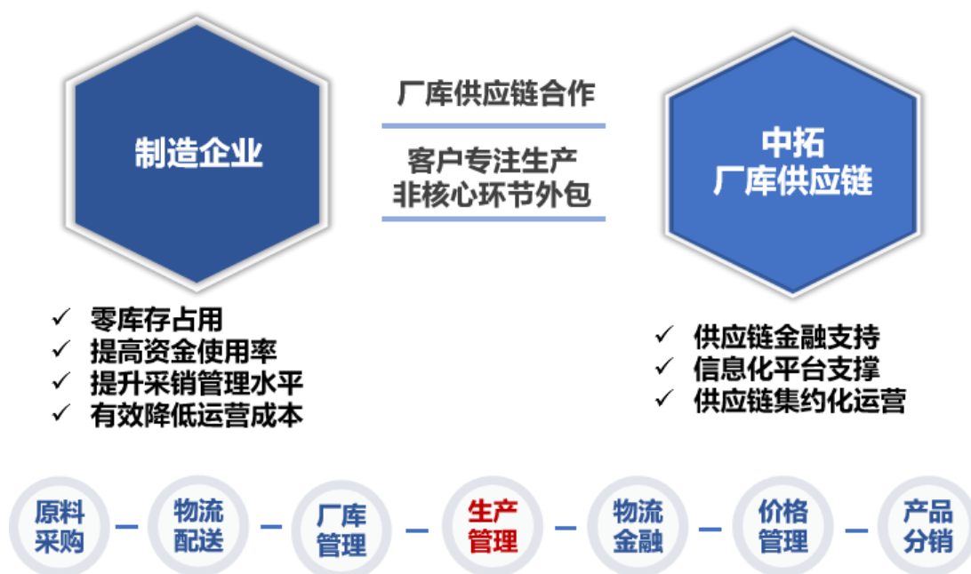
图 3：中拓厂库供应链模式

为满足一定规模制造企业的个性化需求所开发的定制化服务模式。在此模式下，公司深度介入客户生产环节，在其工厂附近或生产区域内设置自管仓库，提供包括原材料采购、产成品销售、库存管理、物流金融、价格管理、生产管理、管理咨询等在内的一站式集成服务，赋能客户降本增效，提升竞争实力。目前公司在山西、广西、浙江、江苏等多个区域均已有成熟项目落地。