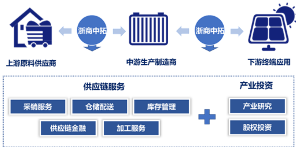
图 6：中拓产业链一体化服务模式

产业链上的生产型企业客户提供原材料采购、库存管理、物流配送、加工服务、供应链金融、行情信息等供应链服务。