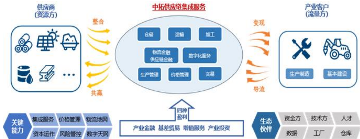
图 8：中拓商业模式一览图

产业投资： 供应链服务过程中，挖掘有价值的投资机会，并通过股权强化商权，实现“股权”和“商权”的良性互动，并获取适当的投资收益。