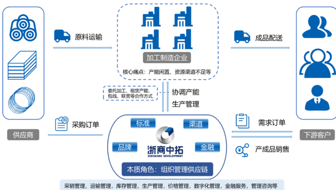
图 7：中拓虚拟工厂模式

虚拟工厂是公司“贸工一体”的升级版，公司凭借渠道、品牌、资金等优势，锁定制造企业全部或部分产能，掌握产成品货权，实现供应链服务与生产制造的融合发展，增强供应链集成服务能力。该模式有效提升了资源利用效率，以相对较低成本满足客户加工需求，提升产业链整体竞争力。在此模式下，公司通过与制造企业合作，强化客户合作粘性，同时获取加工利润。目前虚拟工厂已应用于黑色、化工、新能源领域。