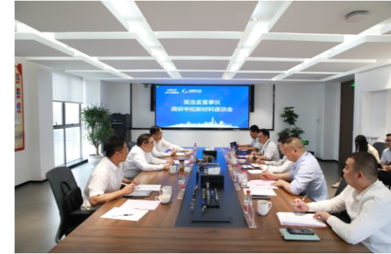
力。要专注制造加工领域，进一步强化生产管理的专业性，持续推进企业做专做精。二是推

高浩孟强调，面临新的发展形势，以及在二期项目即将开工建设的背景下，中拓新材料要重点做好五个方面工作：一是保持战略定