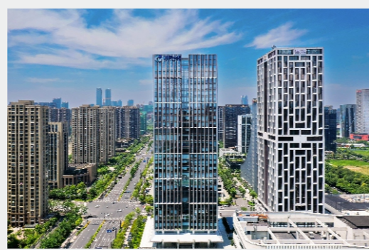
(大厦映蓝天 办公室)