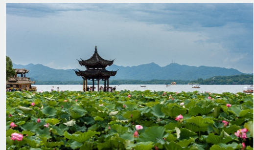
(西湖夏日 中拓信科 谢冰沁)